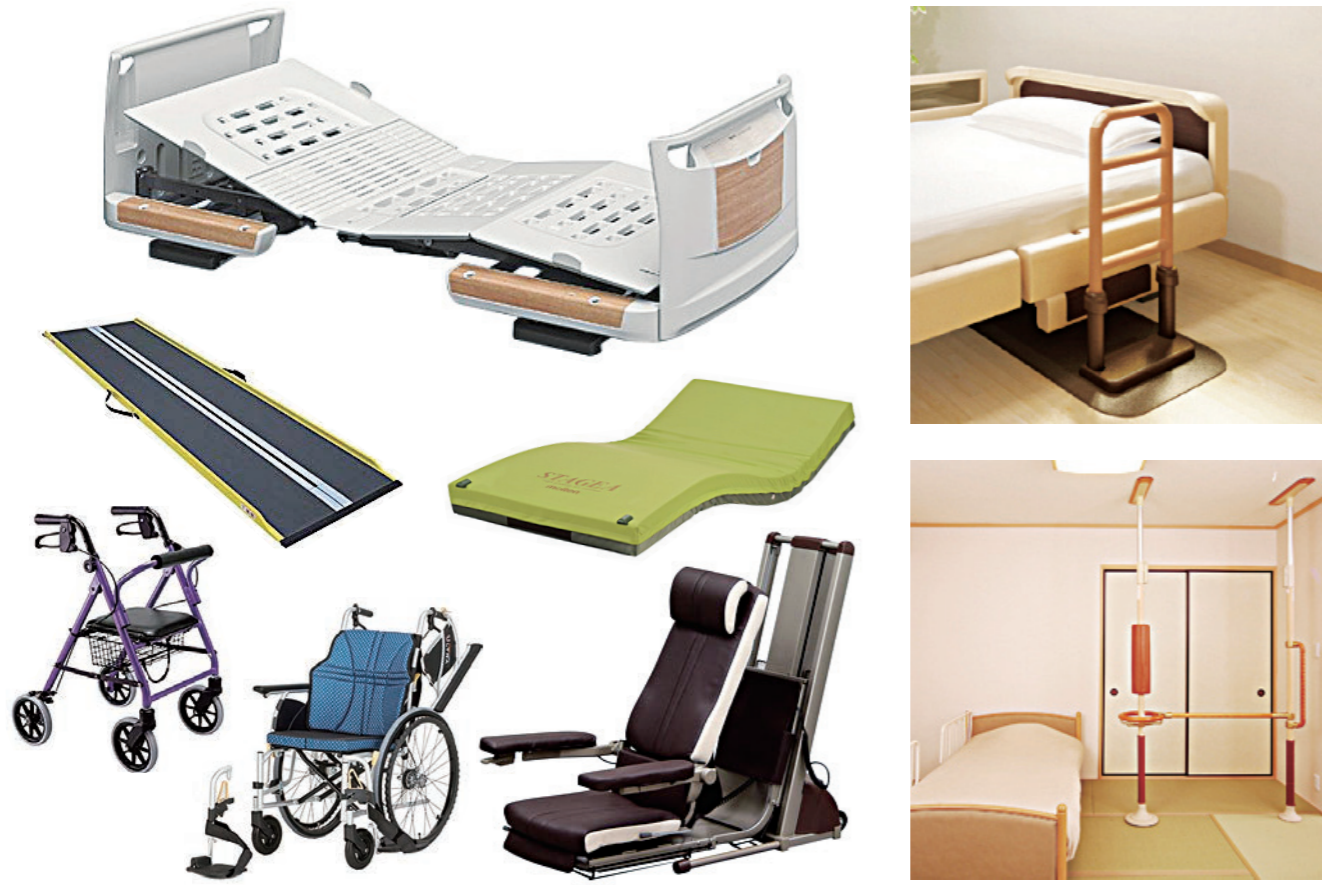
※掲載商品は一部です。

日常生活や介護に役立つ福祉用具をレンタルするサービスです。 ご自宅での介護を行っていくうえで福祉用具は重要な役割を担っています。 お客様のご希望やご利用状況などをお聞きしながら、適切な商品をご提案いたします。